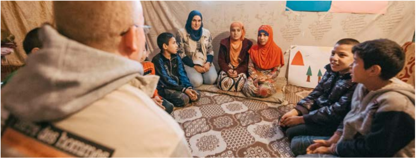
Libanon: Betreuung einer Flüchtlingsfamilie in einem Projekt von Terre des hommes / Lausanne

Regierungen in Hinblick auf konkrete Aspekte direkt angesprochen werden müssen: