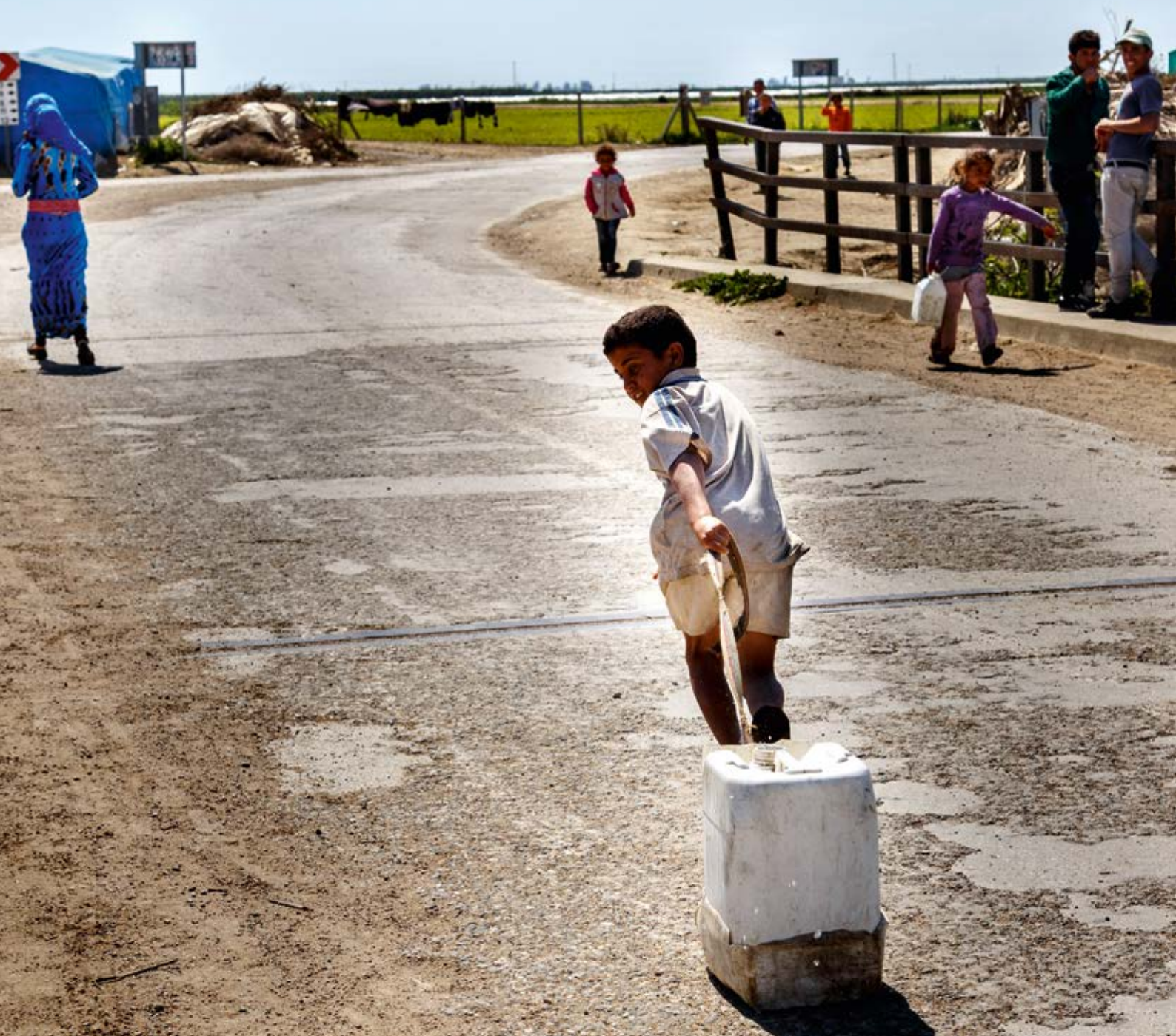
Türkei: Kinderarbeit am Rande eines Flüchtlingslagers

waren Kinder (sowohl unbegleitet oder getrennt als auch mit ihren Familien reisend), die besonderer Aufmerksamkeit bedürfen. Bis Oktober 2015 reisten die meisten Flüchtlinge über Mazedonien, Serbien und Ungarn weiter nach Europa, wenn sie Griechenland durchquert hatten. Seit Schließung der ungarischen Grenze im Oktober 2015 verlagerte sich die Route nach Kroatien, Slowenien und Österreich. Alle Länder entlang der Balkanroute kämpfen nicht nur mit dem hohen Zustrom an Flüchtlingen, sondern auch mit dessen sozialen und politischen Folgen. Griechenland wurde schwer von