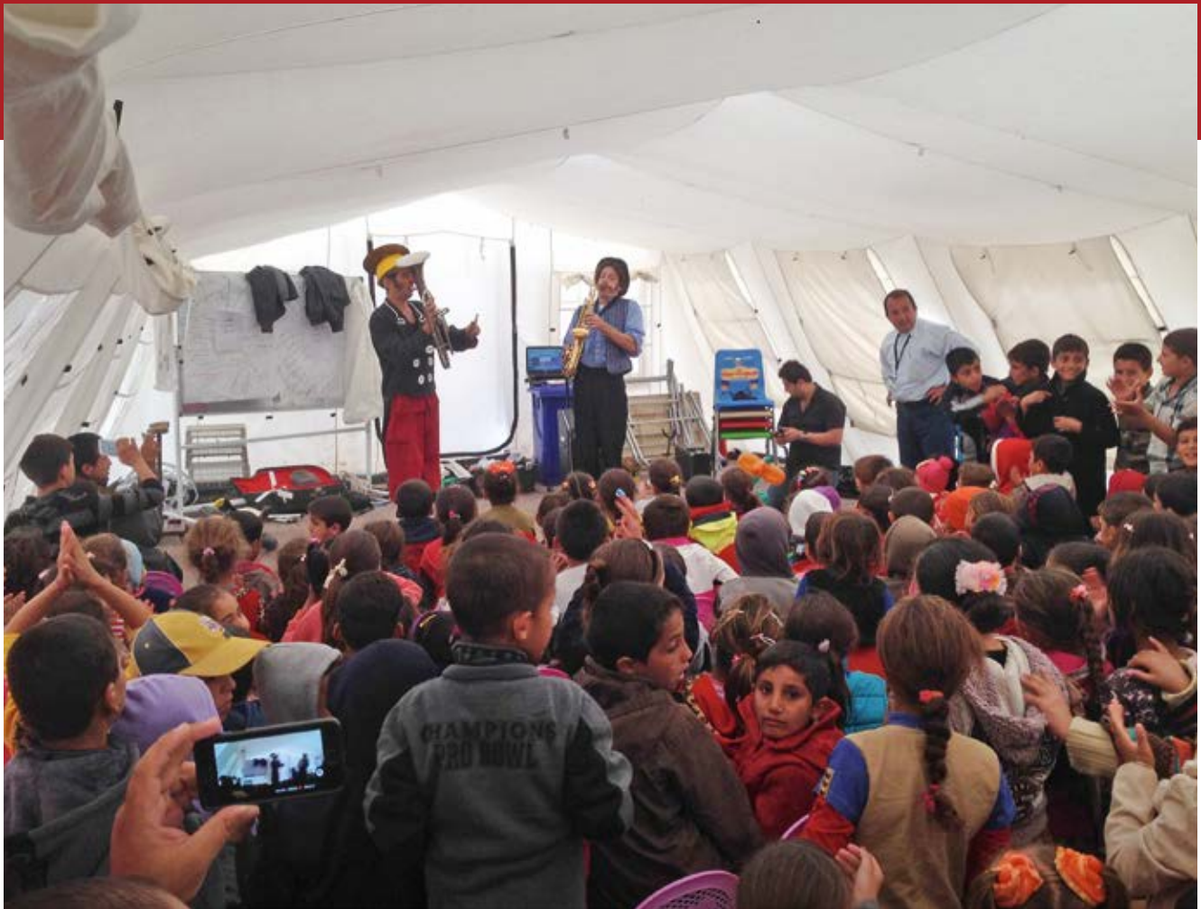
Kinderbelustigung in einem Flüchtlingsprojekt von terre des hommes Niederlande

Nach Angaben des Terre des Hommes-Bereichsleiters für psychosoziale Hilfe in Syrien sind mehr und mehr Kinder gezwungen, eine Arbeit aufzunehmen. Aufgrund des Krieges sind genaue Zahlen nicht verfügbar. Die Familien sind gezwungen, Strategien zu entwickeln, um ihre verzweifelte Lage zu bewältigen. Im Allgemeinen handelt es sich dabei um das Aufbrauchen von Ersparnissen, Verkauf von Besitztümern, Verwendung des Geldes ausschließlich für Essen, Einschränkung der Anzahl der Mahlzeiten, Arbeit von Kindern für Geld oder Nahrungsmittel sowie das Verheiraten von Töchtern, damit diese mit den Familien der Ehemänner in sicherere Gegenden oder Länder fliehen und in wohlhabenderen Familien überleben können – wobei auf diese Weise gleichzeitig ein Familienmitglied weniger ernährt werden muss. Viele Familien nehmen zudem in Kauf, dass ein Kind durch bewaffnete Gruppen rekrutiert wird. Oder sie fliehen in sicherere Gebiete oder in andere Länder, um zu überleben.