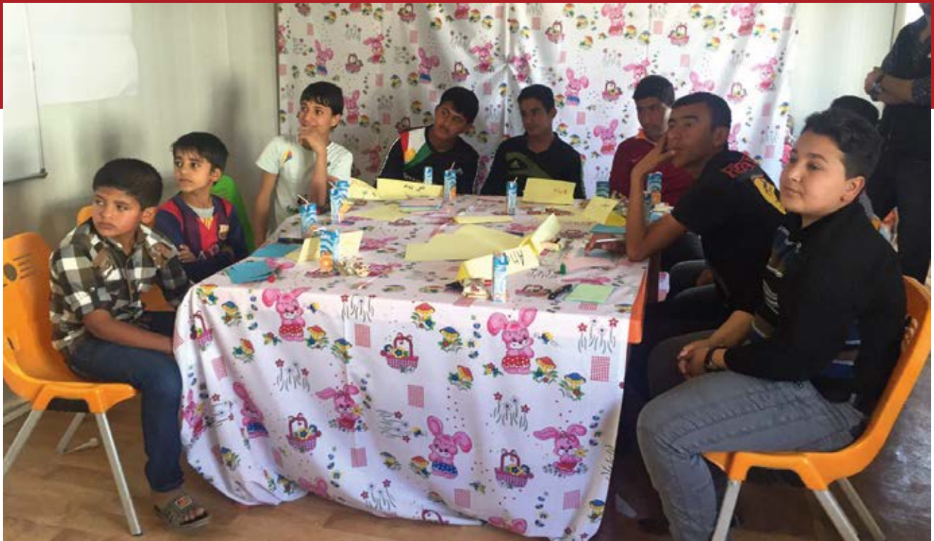
Nordirak: Workshop mit Kindern in einem Projekt von terre des hommes Italien

schutzkoordinator von Terre des Hommes 160 erinnert sich, dass vor 2014 selten arbeitende oder bettelnde Kinder auf den Straßen von Erbil zu sehen waren. Nach der Massenflucht aus Syrien in das kurdische Gouvernement infolge der IS-Angriffe auf die Stadt Mossul und auf die Jesiden im Jahr 2014 ist die Zahl der auf der Straße arbeitenden intern vertriebenen Kinder und Flüchtlingskinder dramatisch gestiegen. Sie verkaufen Kaugummis oder Blumen, putzen Autoscheiben und betteln. Wie in Jordanien und im Libanon gaben die im Irak befragten intern vertriebenen Kinder an, dass sie vor allem arbeiteten, um ihre Familien zu unterstützen. Ihnen zufolge sind Armut und Arbeitsunfähigkeit von Familienmitgliedern die entscheidenden Faktoren für die Kinderarbeit. Außerdem berichteten die Kinder, dass starke Familienwerte, Gruppenzwang und Vorurteile gegen Bildung sie vom Schulbesuch abhielten – was sie wiederum in die Kinderarbeit drängte. 161