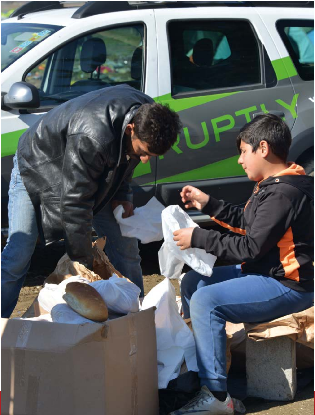
Griechenland: Ein Flüchtlingskind verkauft Gebäck auf der Straße