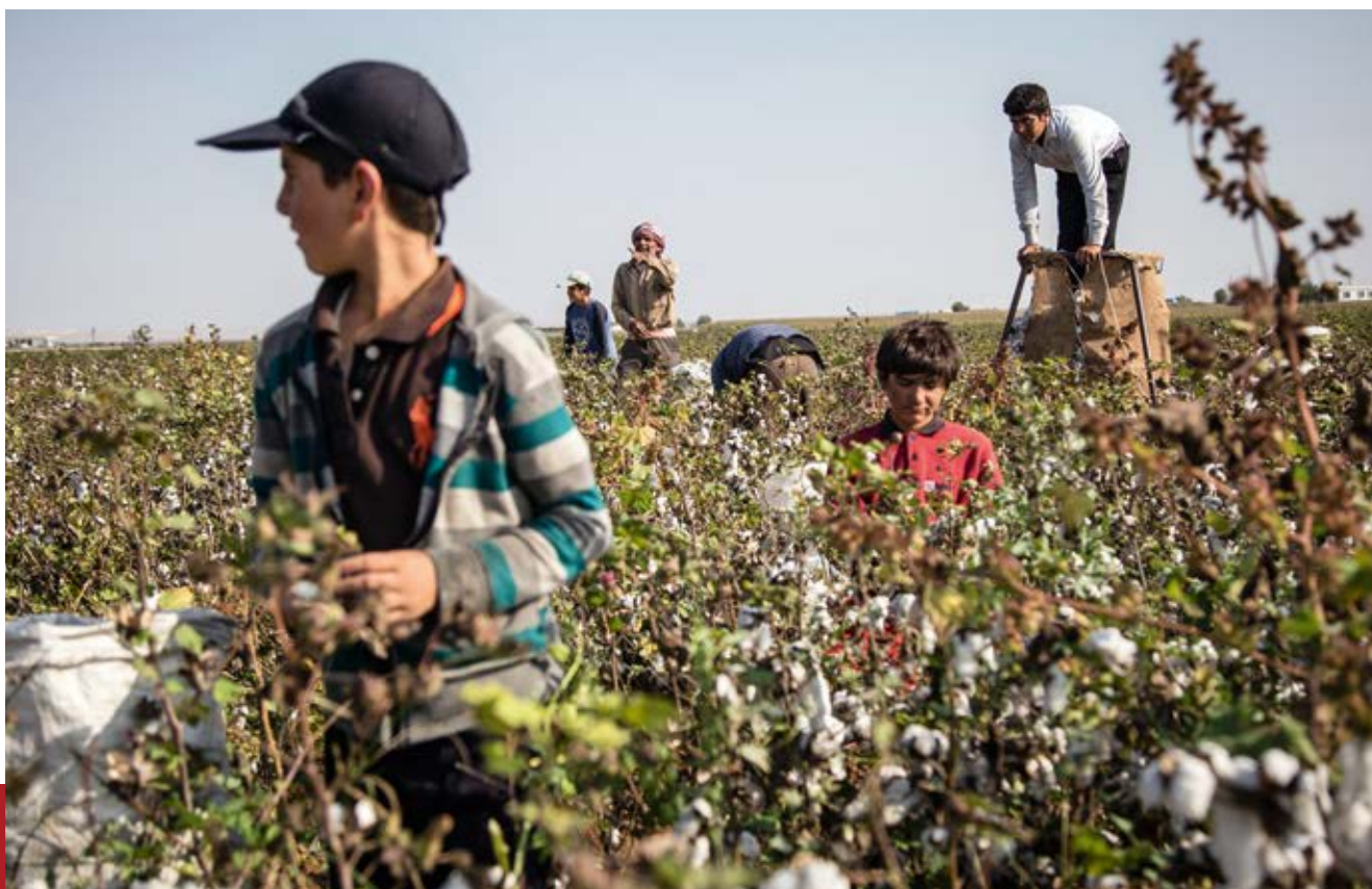
Türkei: Kinder bei der Baumwollernte