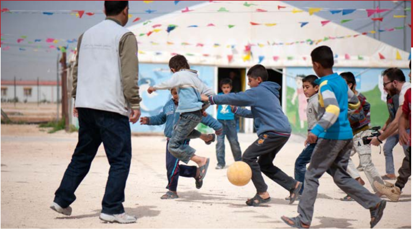
terre des hommes in Jordanien: Aktivitäten helfen Kindern, traumatische Erlebnisse zu überwinden

Fahrtkosten ein Hindernis sind. Drittens haben die Kinder aus verschiedenen Gründen wenig Interesse am Schulbesuch; auch das hindert sie daran, am Unterricht teilzunehmen. Schließlich können zunehmende Spannungen zwischen einheimischen Kindern und Flüchtlingskindern, wie in den Interviews mit dem Terre des Hommes-Koordinator für den Norden Jordaniens erwähnt, in Verbindung mit mangelndem Platz und überfüllten Klassenzimmern zu Gewalt führen. 90 Auch dies könnte dazu beitragen, dass Flüchtlingskinder dem Unterricht fernbleiben. Grundsätzlich hat Terre des Hommes einen großen Bedarf an Aktivitäten zur Förderung sozialer Inklusion festgestellt, damit die Flüchtlingskinder sich weniger benachteiligt fühlen. Zudem könnten die syrischen Kinder auf diese Weise in den Schulen und in den Gemeinden besser integriert und ermutigt werden, die Schule nicht abzubrechen. Der bessere Zugang zur Schule ist wesentlich, um Kinderarbeit zu verhindern. NRO in Jordanien versuchen deswegen derzeit, informelle Schulangebote auszuweiten, um so den Schulbesuch attraktiver zu machen und zu erleichtern.