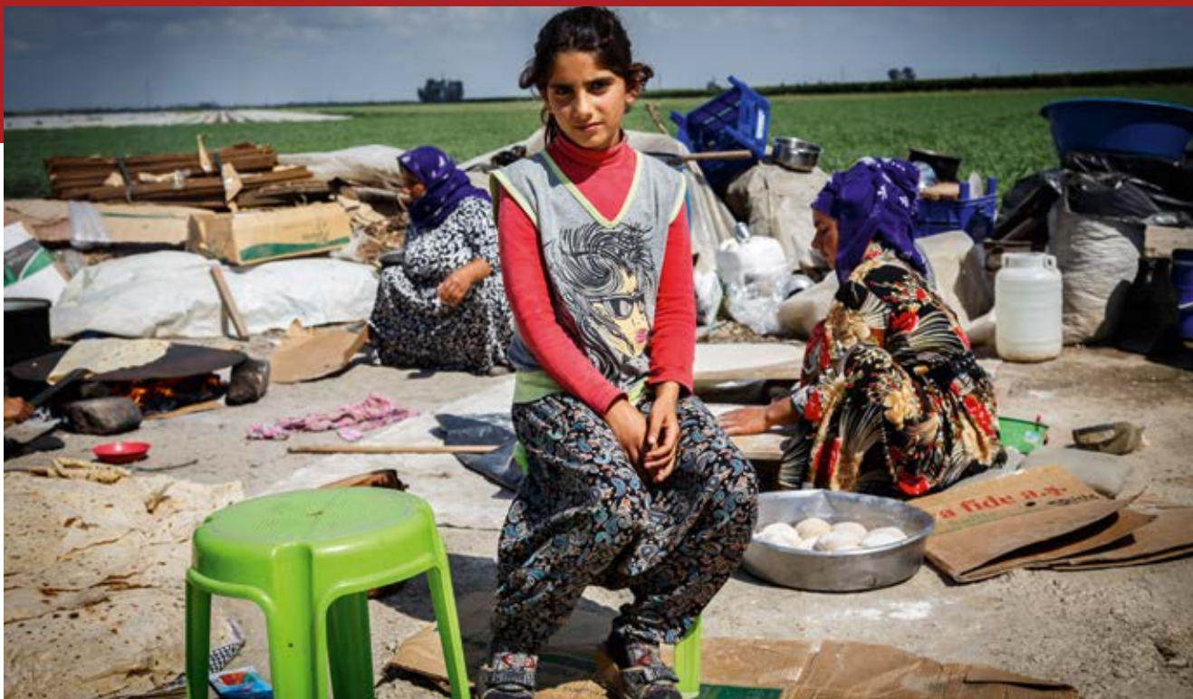
Türkei: Pause von der Feldarbeit. Junges Mädchen bei der Ernte

Arbeit« erlaubt ist. 132 Wenn voller Schutz und eine sorgfältige Einführung in die Tätigkeit gewährt werden, sind »andere« Formen der Arbeit ab einem Alter von 16 Jahren im Einklang mit Artikel 3 von Dekret 8987/2012 erlaubt. 133 Die Umsetzung dieser Bestimmungen in der Praxis ist schwierig, da »leichte Arbeit« im Arbeitsgesetzbuch nicht definiert wird. Außerdem schließt Artikel 7 des Arbeitsgesetzbuches Haushaltshilfen und Arbeiter im landwirtschaftlichen Sektor aus. 134