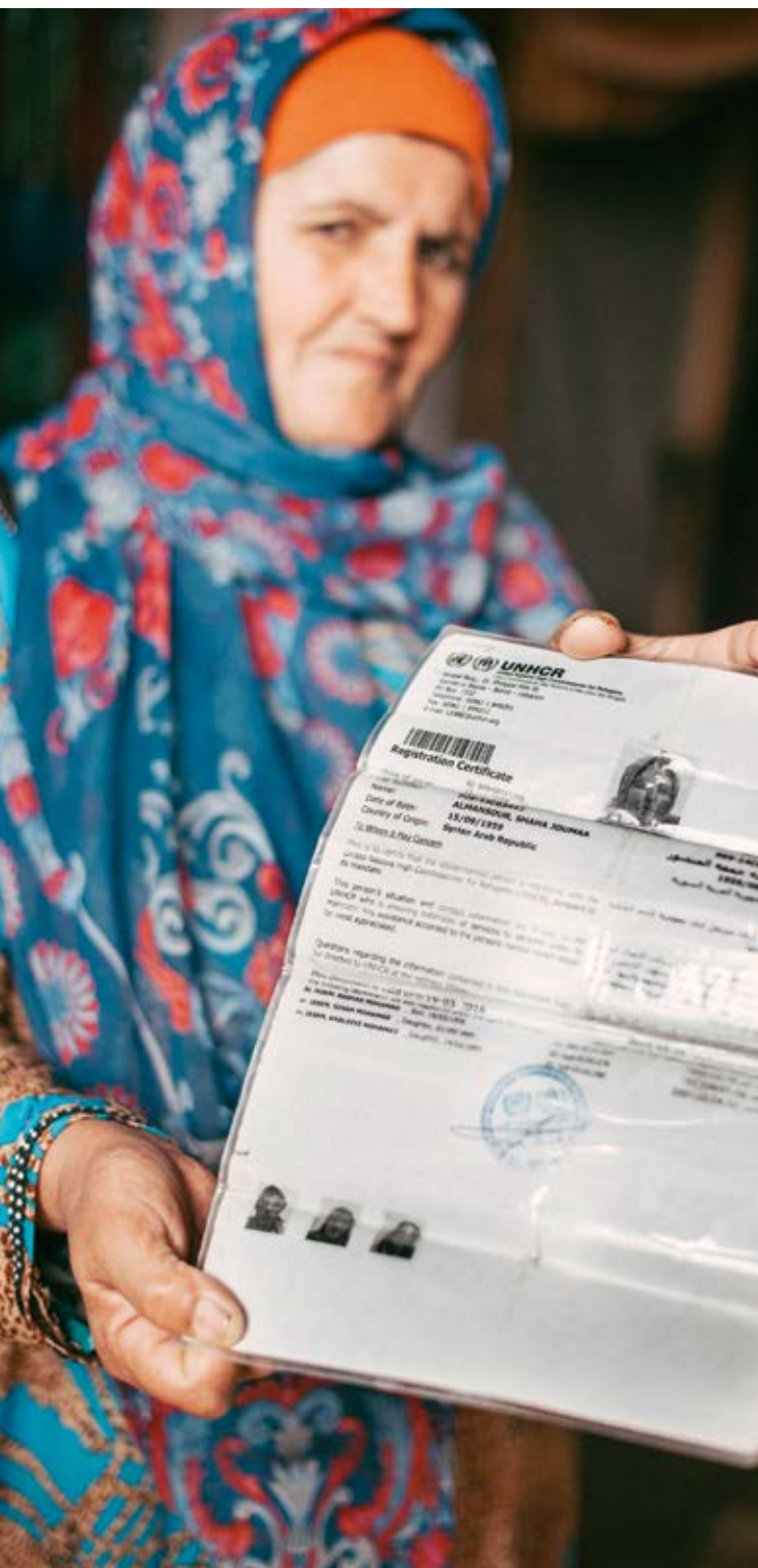
Sie musste 2014 mit ihrer Tochter aus Syrien fliehen

Seit Ende 2014 engagieren sich unter dem »Whole of Syria« 24 -Ansatz humanitäre Organisationen innerhalb Syriens, die entlang des operationellen Drehkreuzes (Syrien, Türkei und Jordanien) Hilfe leisten. In dieser Initiative haben sich 270 internationale und nationale Akteure zusammenschlossen, um gemeinsame Hilfsmaßnahmen durchzuführen und zu koordinieren. Ziel ist es, Überschneidungen bei den Hilfefieferungen zu vermeiden, damit die Hilfe direkt und effizient erfolgen kann.