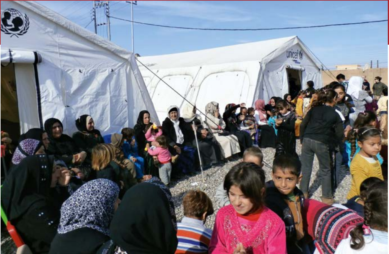
Flüchtlingslager im Libanon

in Jordanien, im Libanon oder im Irak arbeiten oder angefangen hatten zu arbeiten, nachdem sie die syrischen Nachbarländer erreicht hatten (FGD in Serbien und Griechenland).