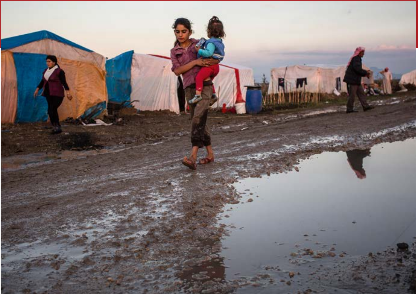
Flüchtlingslager in der Türkei

Prioritäten der humanitären Hilfe 28 zur Verfügung. Mit einem kürzlich angepassten Beitrag zur Krise in Syrien werden über den Humanitären Durchführungsplan (HIP) im Jahr 2016 zusätzliche 130 Millionen Euro zur Verfügung gestellt, um den wachsenden humanitären Bedürfnissen von Vertriebenen und Flüchtlingen in Syrien sowie in der Türkei, dem Libanon und Jordanien zu begegnen. 29 Am 4. Februar 2016 haben Großbritannien, Deutschland, Kuwait, Norwegen und die UN in London endlich gemeinsam eine Konferenz zur Syrienkrise ausgerichtet. Diese hat über elf Milliarden US-Dollar für den