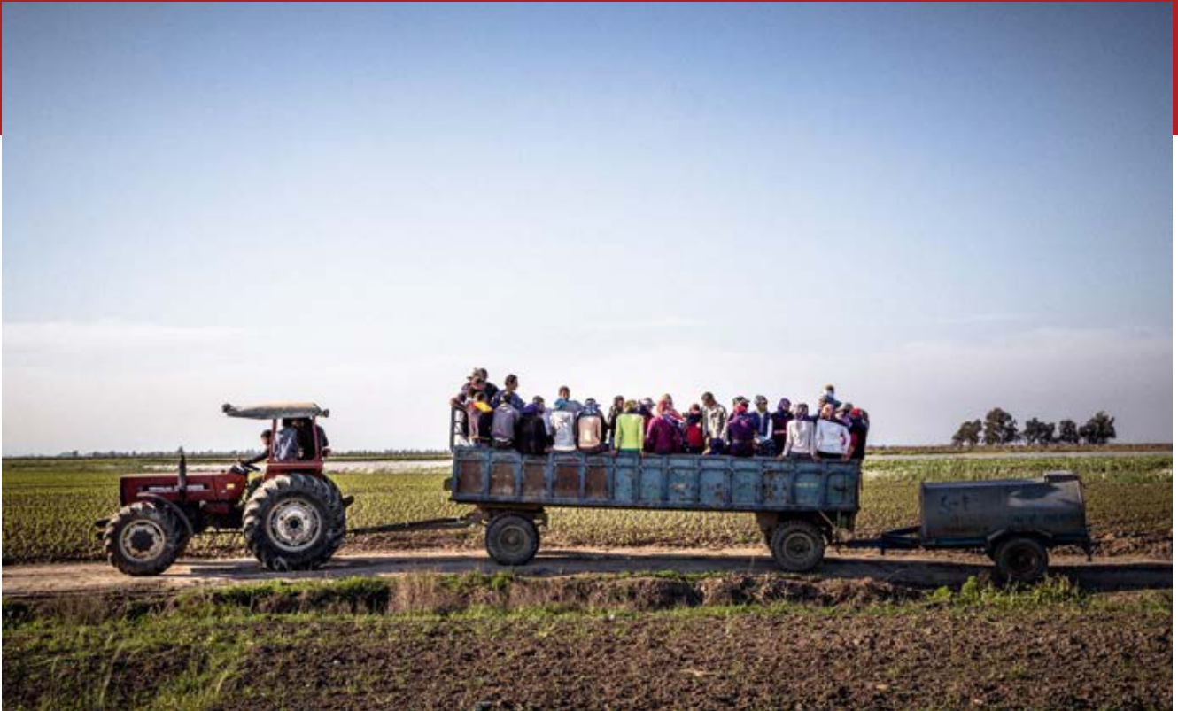
Türkei: Auf dem Weg zum Ernteeinsatz

aus, dass ihre Kinder in Textilfabriken, Fabriken zur Herstellung von Trockenfrüchten, Schustereien und Autowerkstätten beschäftigt seien. Manche pflücken Kirschen oder arbeiten in Bereichen der Landwirtschaft. Andere verkaufen Taschentücher, Wasser oder frische Datteln auf der Straße. Die Aussage eines syrischen Jungen, der an einer von Terre des Hommes organisierten FGD in Serbien teilgenommen hat, illustriert dies: »Vor drei Jahren waren wir in einem Flüchtlingslager in der Türkei. Mein Bruder war damals 15 und arbeitete als Taschenverkäufer auf dem Markt. Er verdiente damit sehr wenig, das Geld haben wir nur für Essen und sonst nichts benutzt. [...] Mein Bruder hat uns damals geholfen, weil unser Vater in Syrien verschwunden ist. Mein Bruder war der Älteste in der Familie, deswegen musste er sich um uns kümmern.« 206