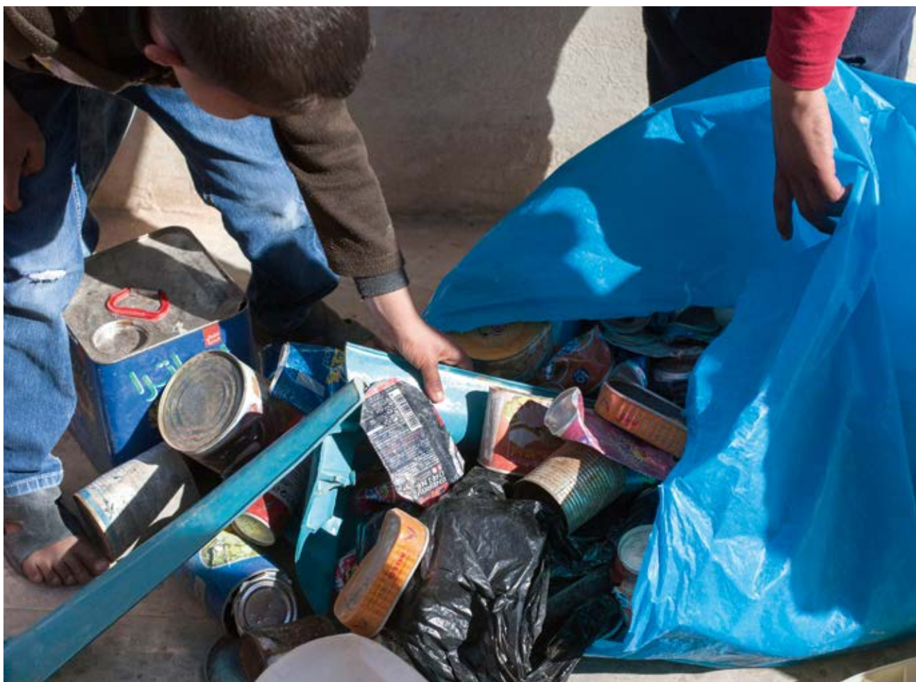
Kinder in einem jordanischen Flüchtlingslager sammeln Altmetalle

diese Arbeiten nicht gefährlich sind, ihrem Ansehen nicht schaden und ihren religiösen Werten nicht widersprechen. Zum Beispiel sagten viele der befragten Jungen aus, dass sie zwar als Straßenverkäufer tätig sind, diese Arbeit aber eigentlich nicht machen wollen, weil »die Menschen denken könnten, dass arbeitende Kinder betteln, wenn sie an Straßenkreuzungen verkaufen«. Auf ähnliche Weise spielt der Glaube eine wichtige Rolle für die Jungen und gibt ihnen vor, welche Tätigkeiten sie nicht ausüben dürfen. Eine Gruppe von Jungen gab zum Beispiel an, dass sie »keinen illegalen Handel betreiben dürfen, zum Beispiel mit Alkohol, Prostitution oder Diebstahl, weil das gegen den Islam ist.« 77